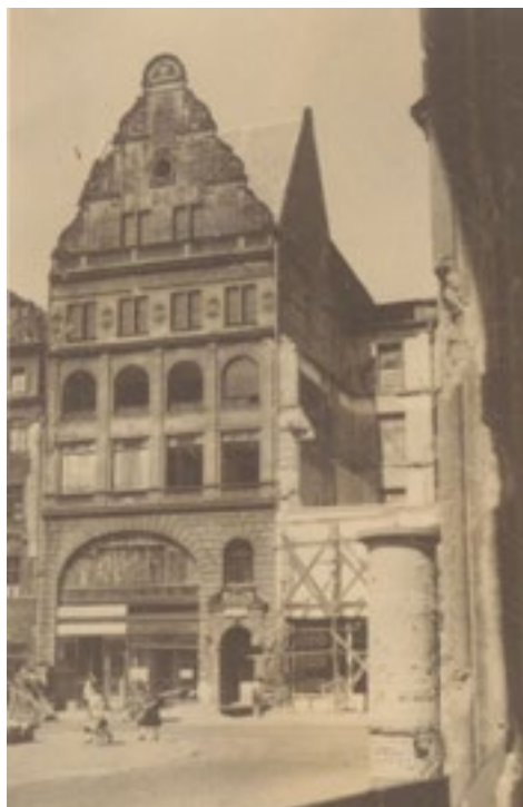
Kamienica Rynek 58, 1947 r. – stan przed remontem, Muzeum Architektury, Archiwum Budowlane Wr (M.A., A.B.), T. 197