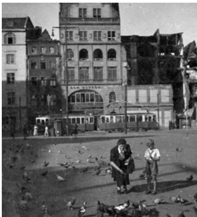
Dom Wzorów podczas Wystawy Ziem Odzyskanych w 1948 r.