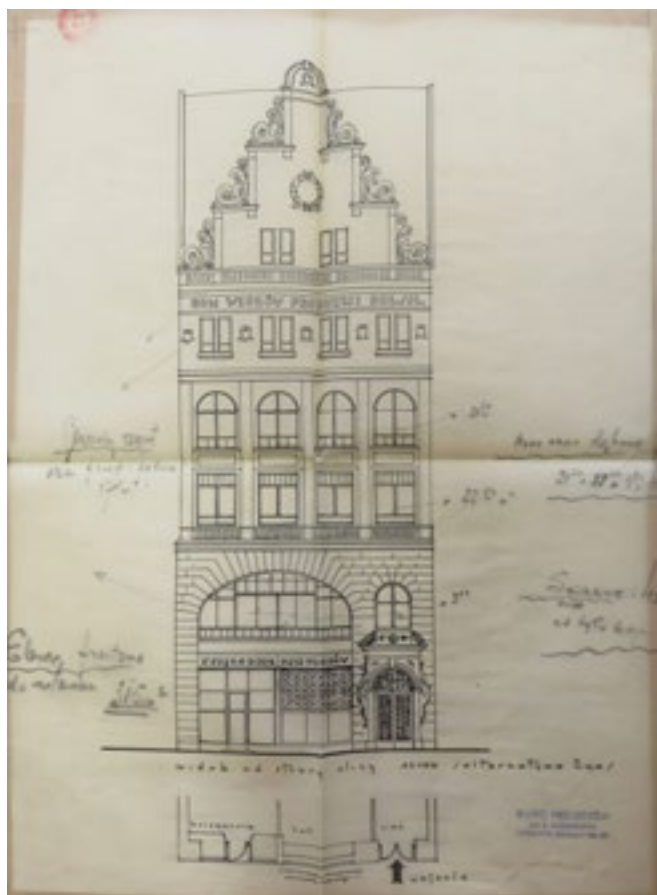
Projekt fasady Domu Wzorów, Rynek 58, APWr, nr zespołu 435/82